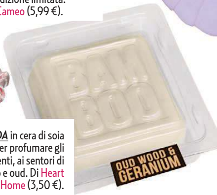
CIALDA in cera di soia per profumare gli ambienti, ai sentori di geranio e oud. Di Heart & Home (3,50 €).