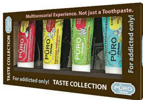
Cofanetto con quattro DENTIFRICI Taste Collection. Di Puro by Forhans (4,90 €).