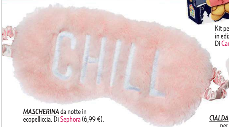
MASCHERINA da notte in ecopelliccia. Di Sephora (6,99 €).