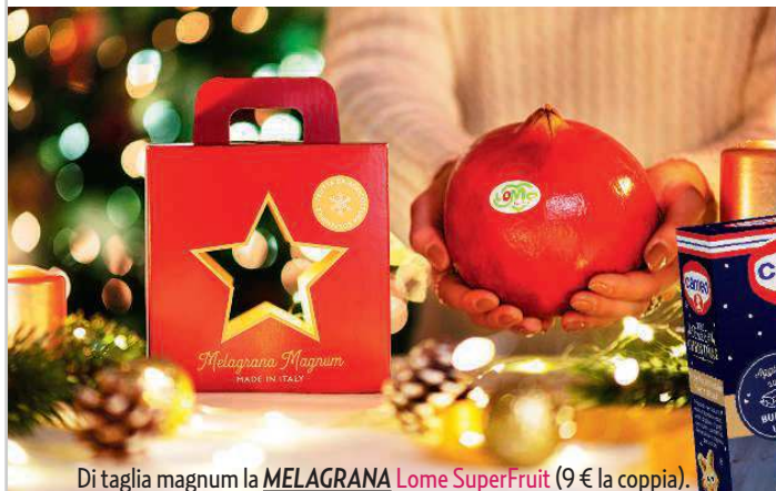
Di taglia magnum la MELAGRANA Lome SuperFruit (9 € la coppia).

di Emanuela Ghislotti – a cura di Danilo Ascani