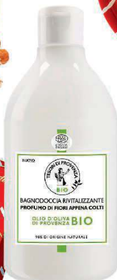
Con olio di oliva biologico il BAGNOSCHIUMA rivitalizzante. Di Tesori di Provenza (5,50 €).