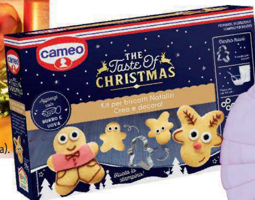
Kit per BISCOTTI natalizi in edizione limitata. Di Cameo (5,99 €).