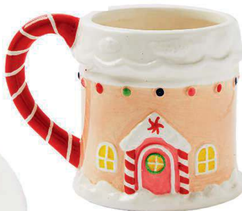
Decorata come la casa di pan di zenzero delle fiabe la TAZZA di Primark (7 €).