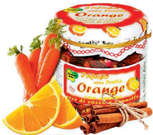
Con agrumi, noce di cocco e cannella l' INFUSO di Trentino Erbe (4,70 €).