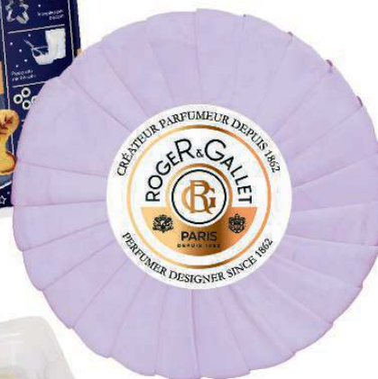
SAPONETTA Lavande Royale di Roger & Gallet (6,90 €).